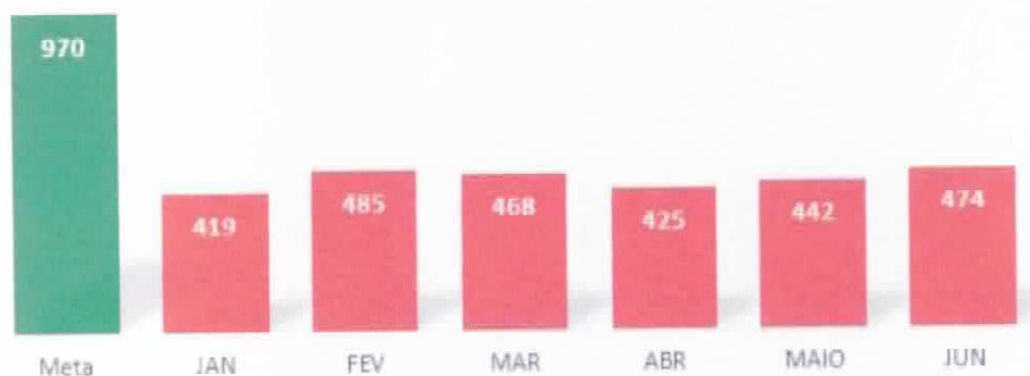
Atendimento de Urgência e Emergência - HURSO 2018